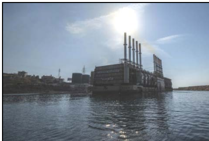
Karpowership 动力船舶 “Orhan Bey”，黎巴嫩